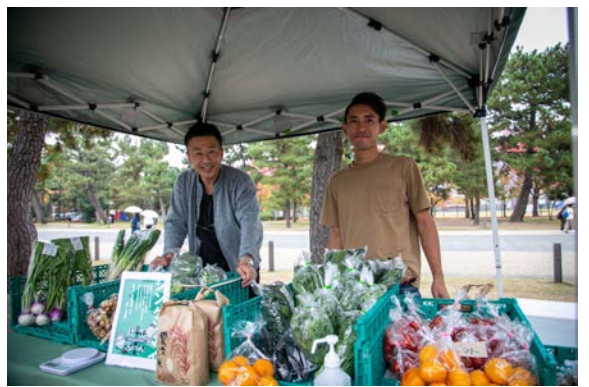
京都の人気店が、趣旨に賛同して下さり、多数、出店して下さいました。