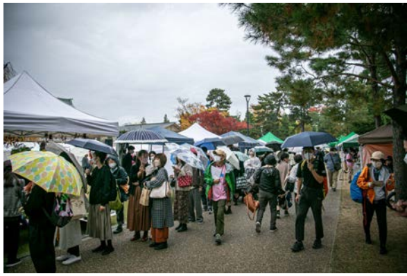
雨にも関わらず大勢の方にお越しいただきました。