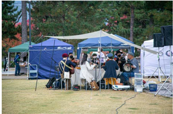
アイリッシュパーティー生演奏の様子。